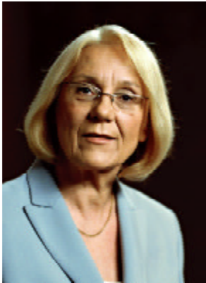
Laila Freivalds Member of the Executive committee and Foreign Minister