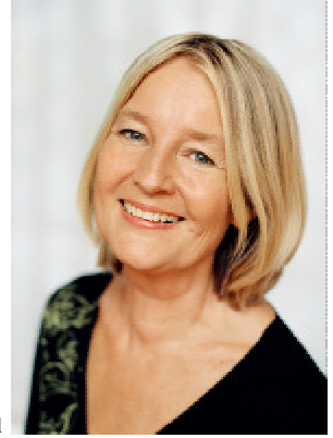
Marita Ulvskog Secretary General