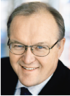
Göran Persson Party chair and Prime Minister