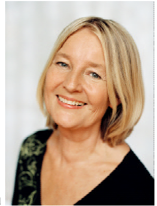
Marita Ulvskog Secretary General