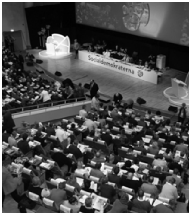
34-ом съезде социал-демократической партии в 2001 году.

нительным делением партийной структуры в больших городах. Окружные организации отвечают за политику в своих округах и выдвигают кандидатов для парламентских выборов, основываясь на результатах выборов в муниципальных организациях. Окружные организации также выдвигают кандидатов в ландстинги.