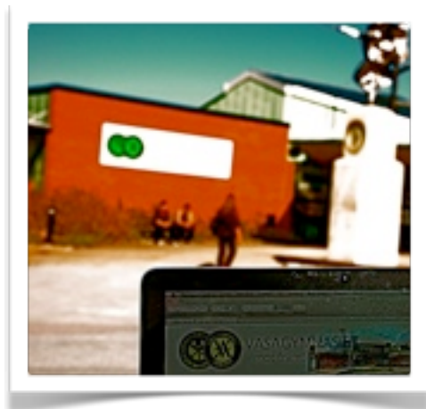
I budget 2012 ingår en första satsning på bärbara datorer till elever på Vasagymnasiet

En investering definieras som ett inköp som är avsett att innehas stadigvarande i kommunen och som har en ekonomisk livslängd på minst tre år samt överstiger ett prisbasbelopp exklusive moms (42 800 kr år 2011). Under några år har övergångsregler kunnat utnyttjas för att anpassa till de förändrade regler som definitionen innebär. Fr.o.m. år 2012 gäller definitionen av investering fullt ut.