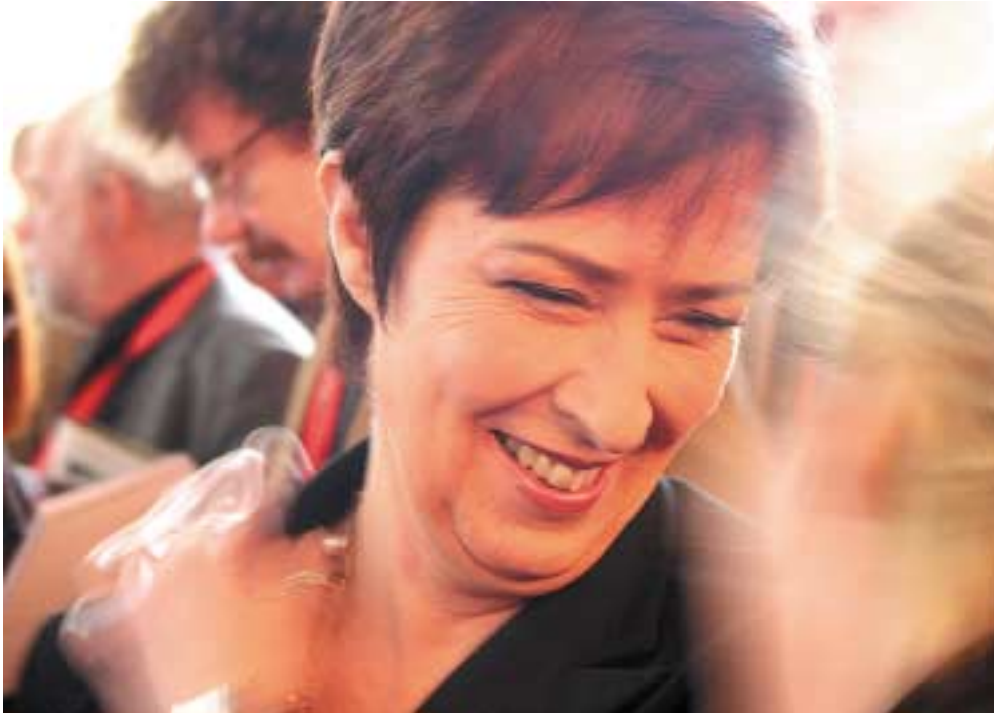
Socialdemokraternas första kvinnliga partiledare – Mona Sahlin.