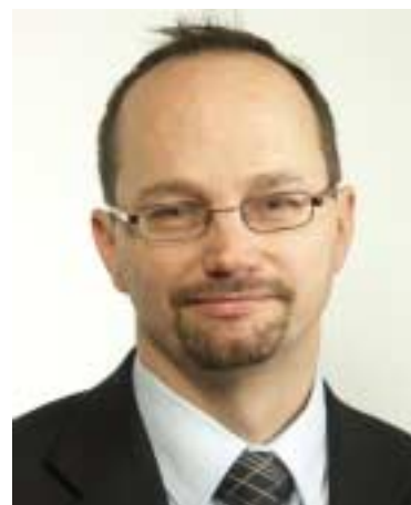
Tomas Eneroth (S) inspireras av samarbetet i Botkyrka.

– Det var lärorikt att besöka Botkyrka där våra partier samarbetar framgångsrikt. Jag tar intryck av detta samarbete. Dessutom är Botkyrkas arbete med kreativitet och entreprenörskap en källa till inspiration, säger Tomas Eneroth (S), riksdagsle-