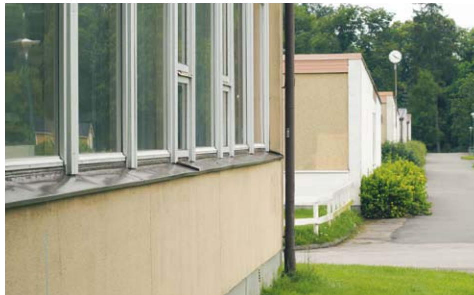
Dagens Teglas skola är sedan många år nedsliten och har blivit utdömt vid ett flertal tillfällen.

Vi vill att nuvarande Djäkneskolan utvecklas till ett levande kulturhus/rådhus i centrala Skara. Här skulle kultur och ungdomsverksamhet samsas och utvecklas under ett