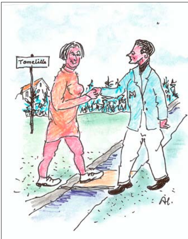
Moderaterna går över ån efter ledarekraft. Illustration: Arne Lang.