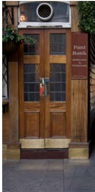
Pantbank – tillfällig räddning?

rens bedömning inte är tagen helt ur luften, även om den inte uppfyller försäkringskassans krav fullt ut. Det måste finnas en dialog mellan organisationerna, vars underlag ligger till grund för bedömningar, så att personer inte drabbas i onödan rent ekonomiskt.